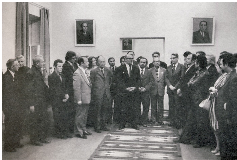
La Congresul Uniunii Compozitorilor și Muzicologilor