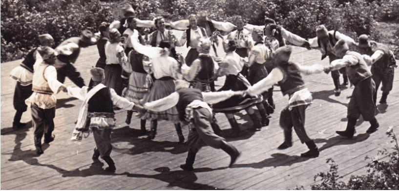
Dansează „Jocul”. Cadrul din filmul „Melodii moldovenești”. 1955