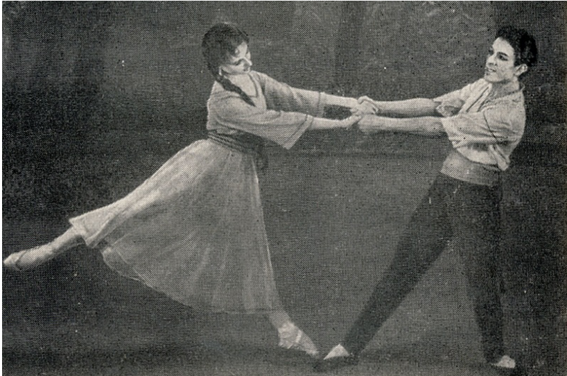
Scena din baletul „Zorile”. 1960