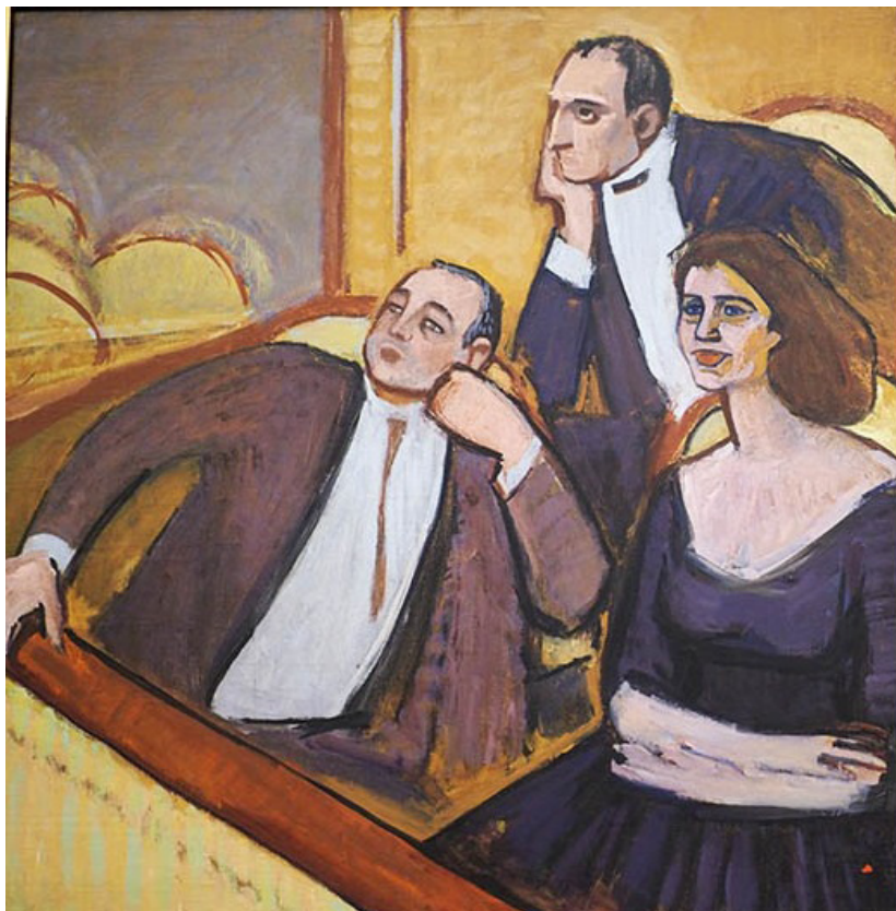
Triplul portret al compozitorilor Alexei Stârcea, Vasile Zagorschi și al cântăreței Valentina Savițkaia. 1963