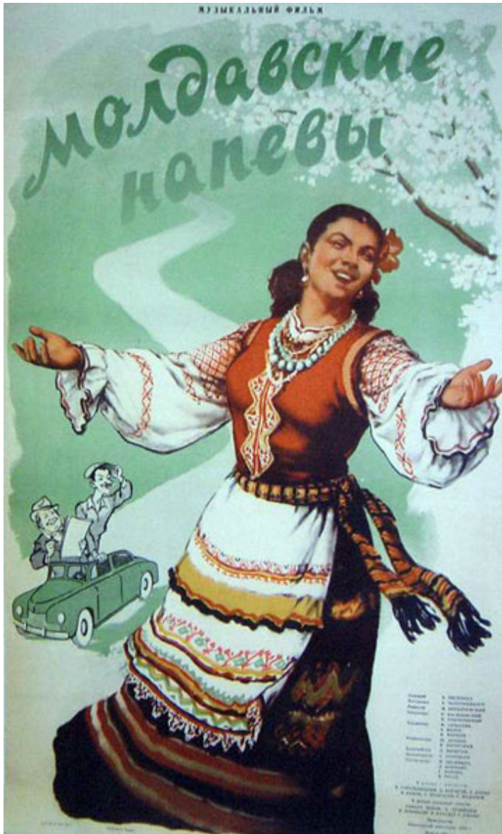
„Melodii moldovenesti”. 1955