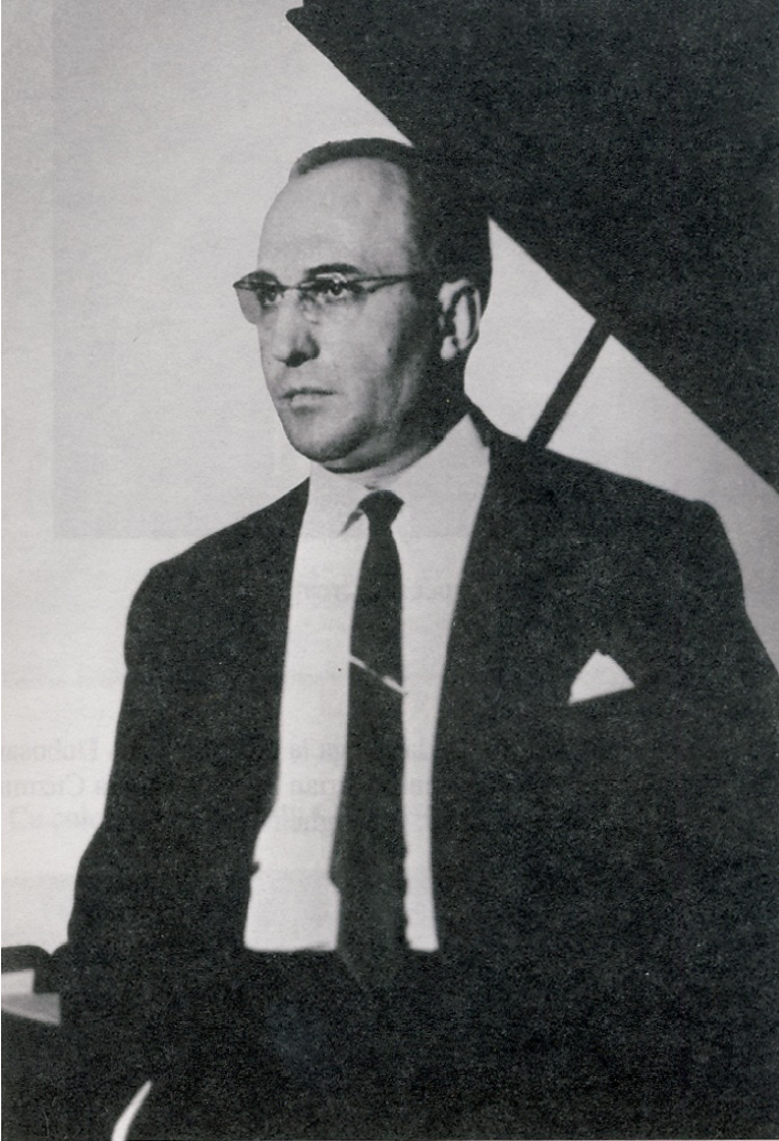
Compozitorul Vasile Zagorschi. Anii '70