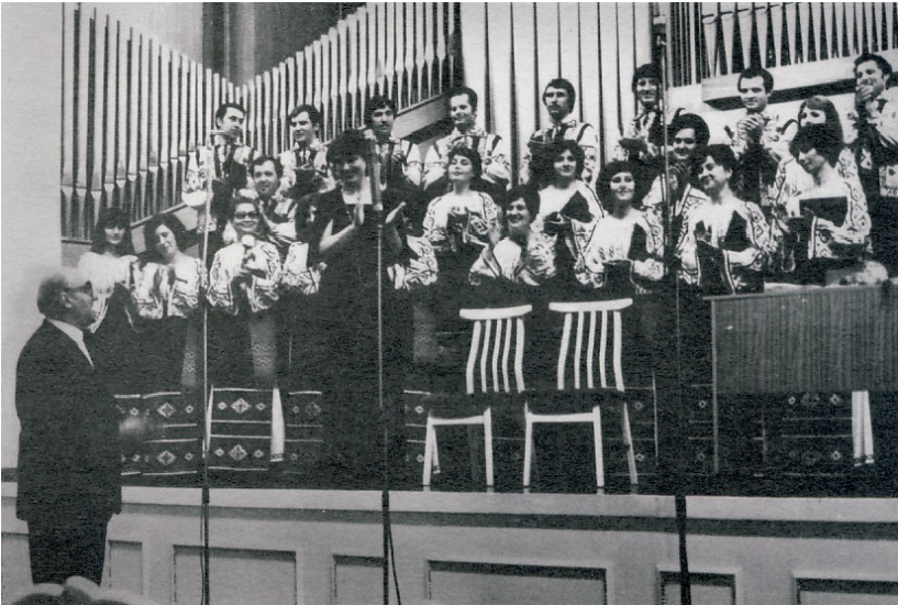
La premiera cantatei „Cine scutură roua” în Sala cu Orgă