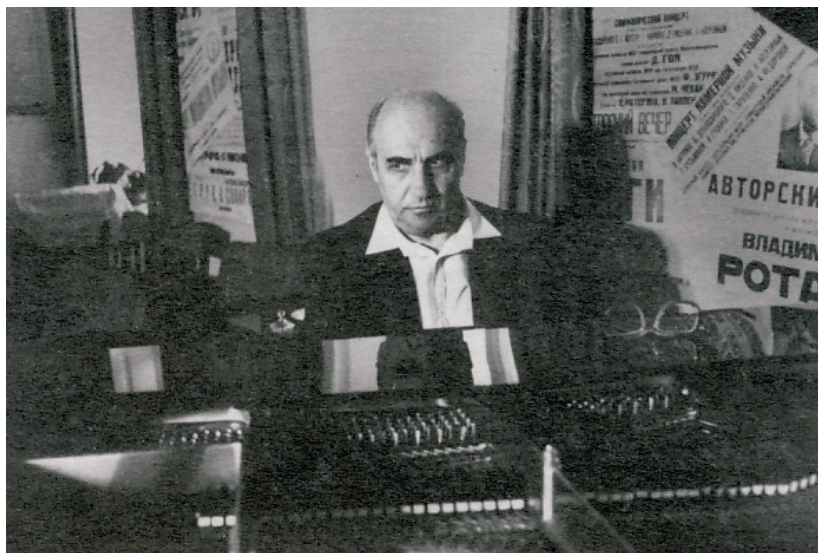
Maestrul la pian