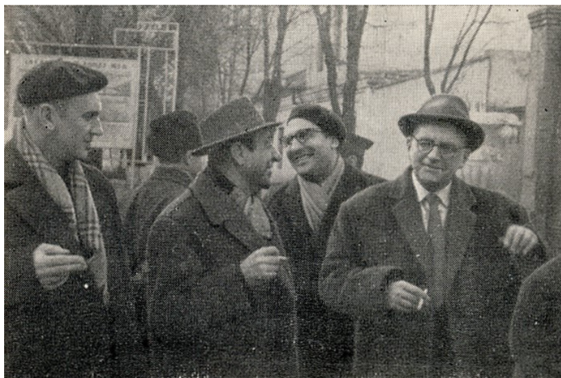
Alături de compozitorii Dmitri Șostakovi, Arcadii Ostrovski și Nikolai Peiko. 1963